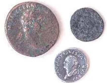
Römische Münzfunde aus Stadtbergen

Schon in ältester Zeit, zur Zeit der Römer und durch die folgenden Jahrhunderte hindurch hatte der Raum der heutigen Einheitsgemeinde Stadtbergen das Schicksal der nahen Stadt Augsburg zu teilen und vor allem in Kriegszeiten als Aufmarschgebiet vor dem befestigten Augsburg zu leiden.